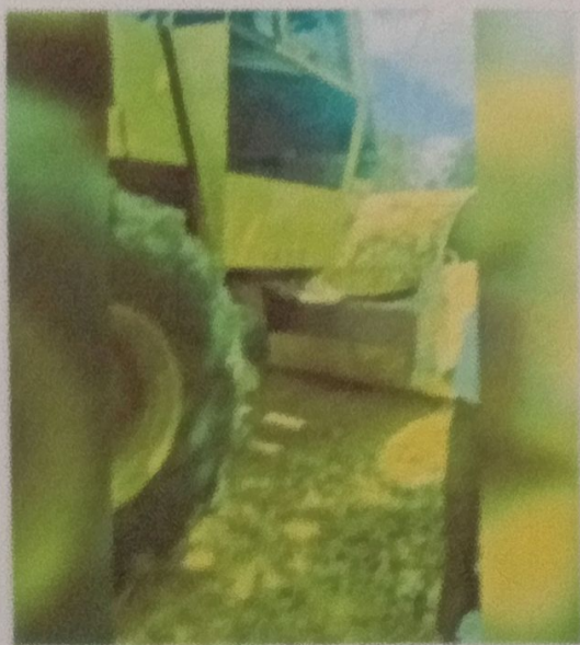
enero 29, 2026